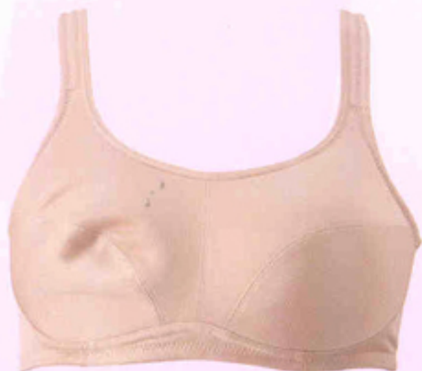
ก่อนใส่เต้านมเทียม

เต้านมเทียม (Breast Cushion) ออกแบบพิเศษเพื่อให้ความรู้สึกใกล้เคียงกับเต้านมธรรมชาติ ด้วยลักษณะหยดน้ำแวนอน ภายในทำด้วยเส้นใยซอฟต์แวร์ BSR Micro Bead แทนน้ำหนักที่หายไป และ Micro Foam แทนสัมผัสอ่อนนุ่มของเต้านมที่สูญเสียไป สามารถใส่กับชุดว่ายน้ำและชุดอื่นๆ ได้ มีให้เลือกหลายขนาด