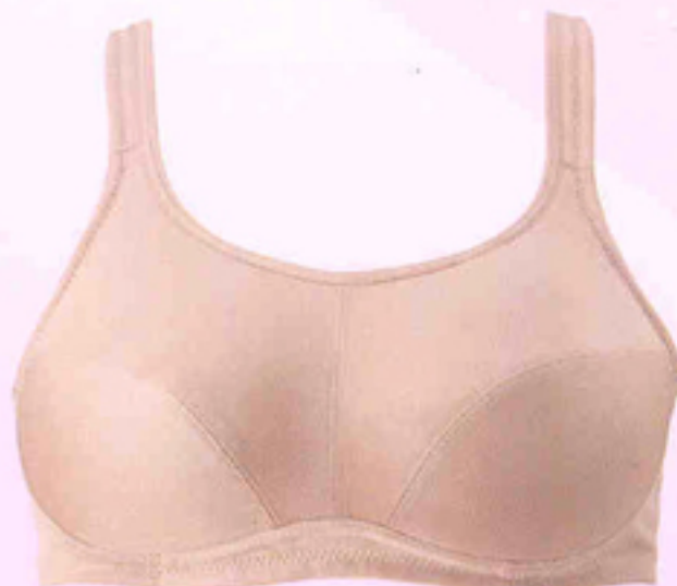
หลังใส่เต้านมเทียม